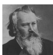
Johannes Brahms 1833 - 1897