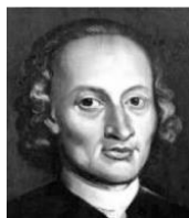
J. Pachelbel 1653 - 1706

Six concerts (30 à 45 ') autour de l'orgue, 3 h 20 de musique au total, 10 musiciens du Conservatoire (orgue, flûte, cor) interprétant 18 compositeurs des XVII e et XVIII e s. jusqu'au XXI e siècle, parmi les plus prestigieux :