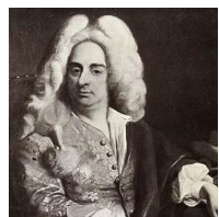
J.C.F Fischer 1656 -1746