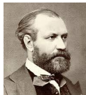
Charles Gounod 1818 - 1893