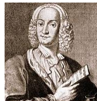
A. Vivaldi 1678 - 1741