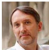
Olivier Latry (1962)