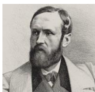
L.J.A. Lefébure-Wély 1817-1869