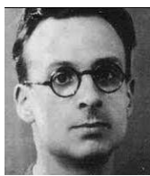
Jehan Alain 1911- 1940