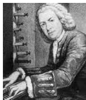
J.S. Bach 1685-1750