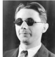
Gaston Litaize 1900- 1991