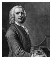
John Stanley 1712 - 1786