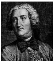
L.N. Clérambault 1676 - 1749