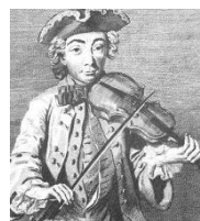
Michel Corrette 1707-1795