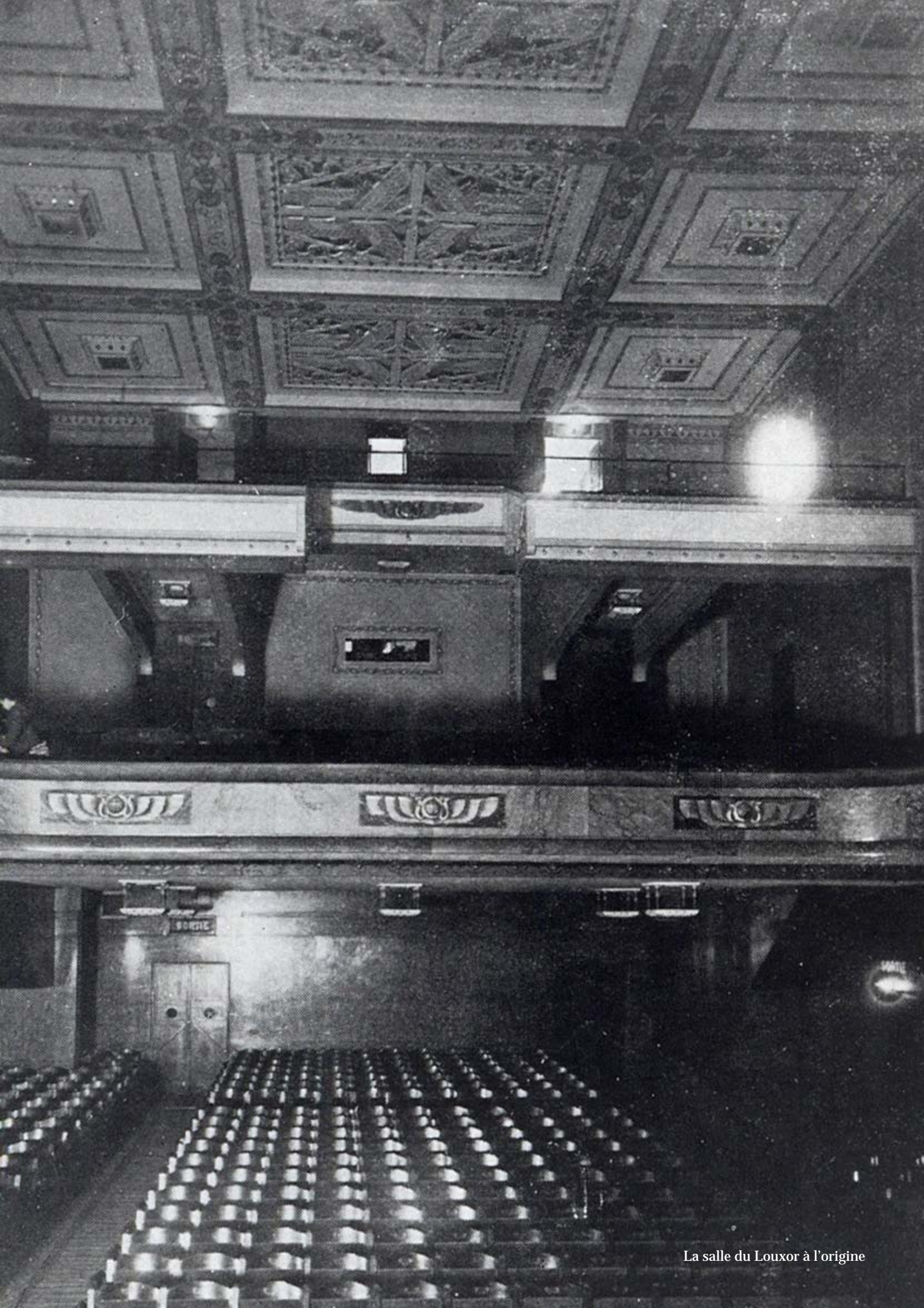
La salle du Louxor à l'origine